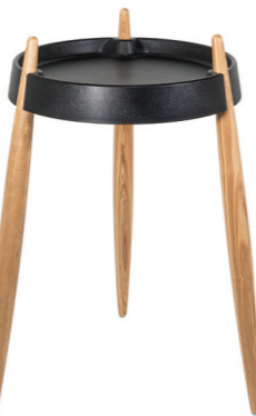
ZLS0104 Nero - Frassino naturale Black - Natural wood