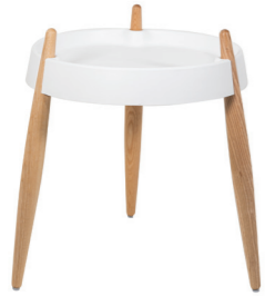
ZLS0001 Bianco - Frassino naturale White - Natural wood