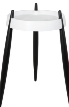
ZLS0102 Bianco - Frassino nero White - Black wood