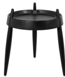
ZLS0005 Nero - Frassino nero Black - Black wood