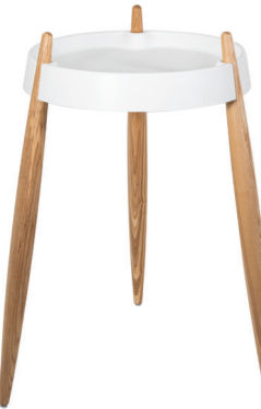
ZLS0101 Bianco - Frassino naturale White - Natural wood