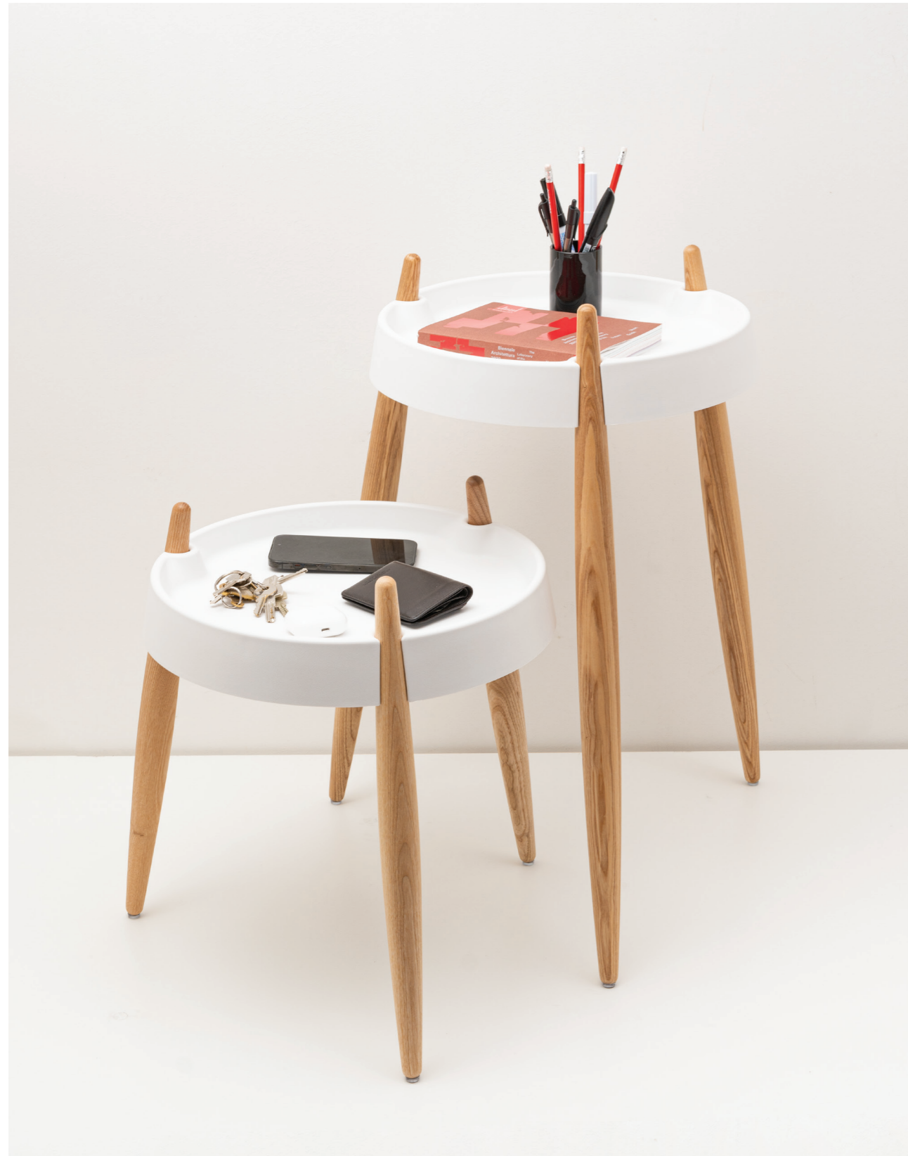
Liola table (ZLS0001), Liola high table (ZLS0101)