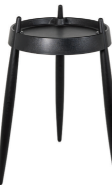
ZLS0105 Nero - Frassino nero Black - Black wood