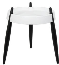
ZLS0002 Bianco - Frassino nero White - Black wood