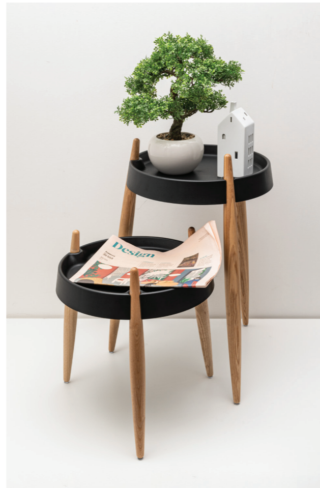
Liola table (ZLS0005), Liola table (ZLS0005), Liola table (ZLS0004), Liola high table (ZLS0104), Liola table (ZLS0002)