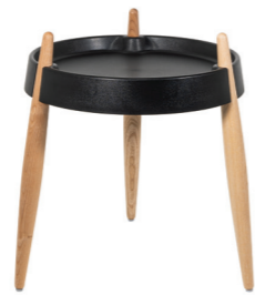
ZLS0004 Nero - Frassino naturale Black - Natural wood